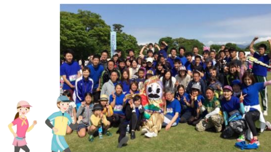
金沢リレーマラソン