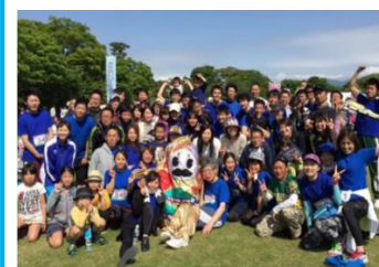
(金沢リレーマラソン)