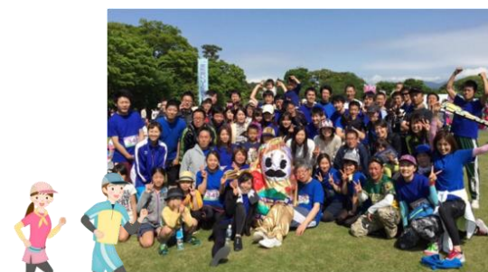
金沢リレーマラソン